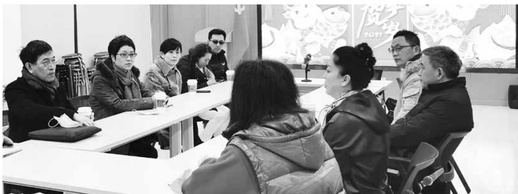
区政协副主席欧阳萍带领区相关职能部门实地走访长征镇泾泰苑居民区，看望慰问社区工作者，向他们送上新春祝福。